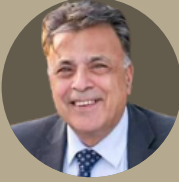
السفير بشار ياغي